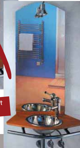
Spiegel mit Slimfoil™