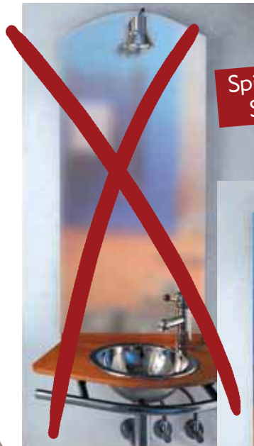
Spiegel ohne Slimfoil™